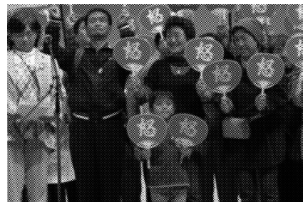
13年の日本平和大会in岩国

分科会⑥ 映画ザ・思いやりpart II上映とバクレー監督と語る会 動く分科会 岩国基地を中心に視察