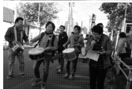
昨年の平和大会in三沢パレード