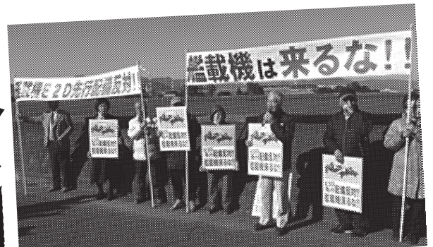
岩国基地強化に反対し抗議する人たち=17年2月