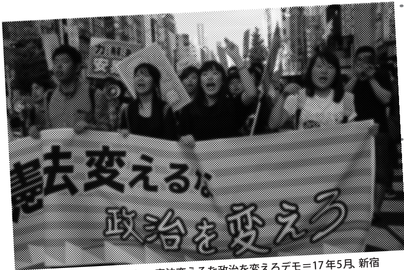
いま若者が声を上げる。憲法を変えるな政治を変えろデモ=17年5月、新宿