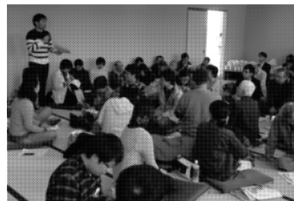
昨年の平和大会in三沢分科会